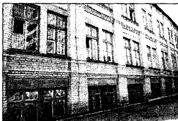
Будівля, у якій розташована бібліотека. 2012 р.

1962 р. — стала координаційним та методичним центром для науково-технічних бібліотек галузі;